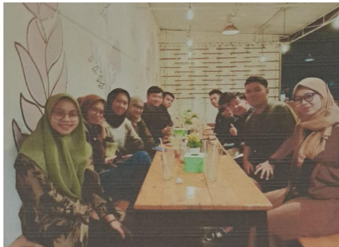
Gambar 2. Pertemuan dengan komunitas (karang taruna)

tampil sebagai fasilitator dan penggerak dalam komunitas. Mereka berperan aktif dalam menyuarakan kepentingan masyarakat dan memimpin inisiatif lokal, yang berdampak pada peningkatan solidaritas dan kerjasama antar warga. Terciptanya kesadaran baru menuju transformasi sosial juga menjadi salah satu hasil penting dari program ini. Masyarakat kini lebih terbuka untuk berdiskusi dan berkolaborasi dalam mencari solusi atas masalah yang dihadapi. Dengan meningkatnya partisipasi dan keterlibatan dalam proses pembangunan, kami optimis bahwa perubahan yang positif ini akan berkelanjutan dan membawa dampak jangka panjang bagi kesejahteraan komunitas.