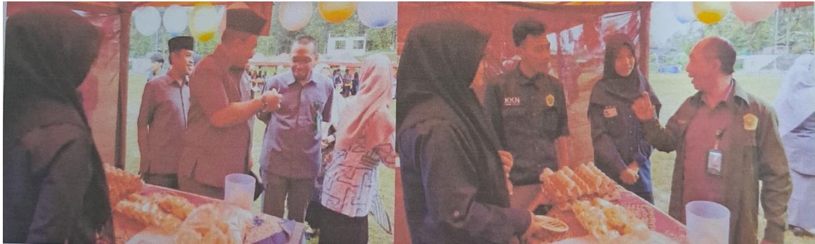
Gambar 4. Pengembangan usaha mikro (expo)