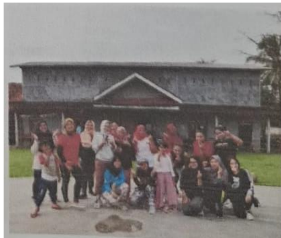
Gambar 3. Perencanaan dan Pelatihan